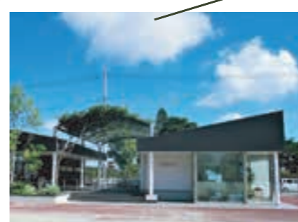
南駐車場ウィステリア