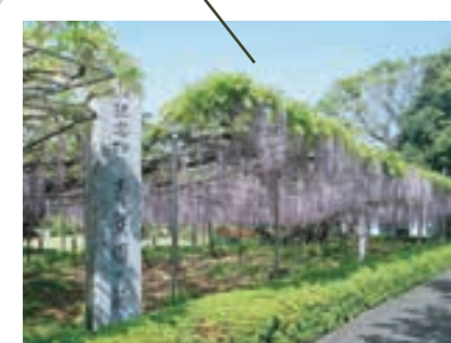
天然記念物の青葉園の藤