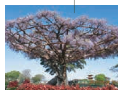
青葉慈蔵尊前の藤棚